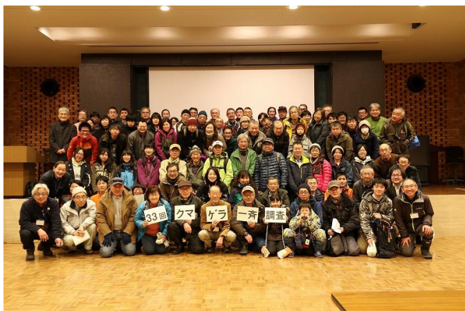
写真1. 参加の皆さん「調査に行つて来ま〜すハイポーズ！」