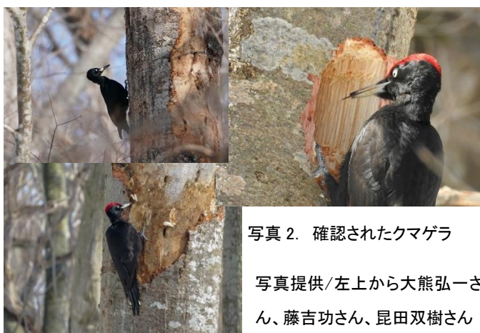
写真2. 確認されたクマガラ